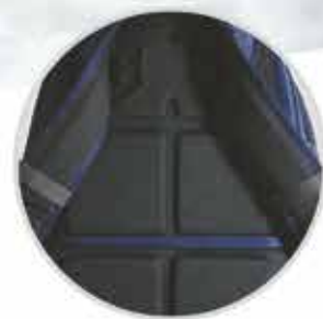
PANELES DORSALES Y CORREAS DE HOMBRO MOLDEADOS POR COMPRESIÓN que ofrecen un confort superior durante el uso prolongado