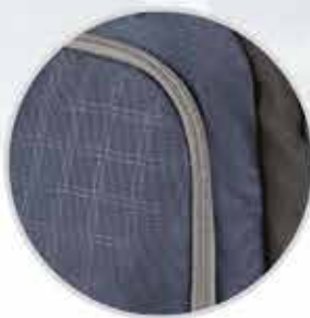
TEJIDO DURABLE VERSATEK en el cuerpo principal extraordinariamente resistente al desgaste por fricción