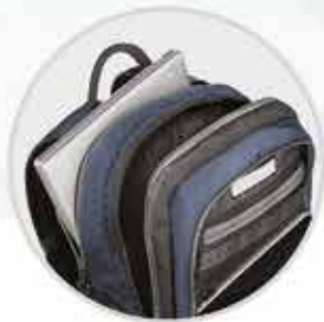
PROTECCIÓN ACOLCHADA para una laptop y una tablet