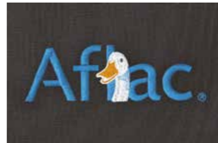
Two examples of embroidered Company-logos Dos ejemplos de logotipos de empresa bordados Due esempi di loghi aziendali ricamati