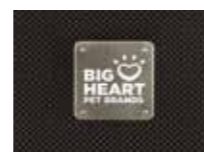
Square Brushed Silver Finish 3 x 3 cm Cuadrado acabado plateado cepillado 3 x 3 cm Modello quadrato argento spazzolato 3 x 3 cm