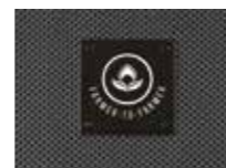
Square Black Finish 3 x 3 cm Cuadrado acabado negro 3 x 3 cm Modello quadrato nero 3 x 3 cm